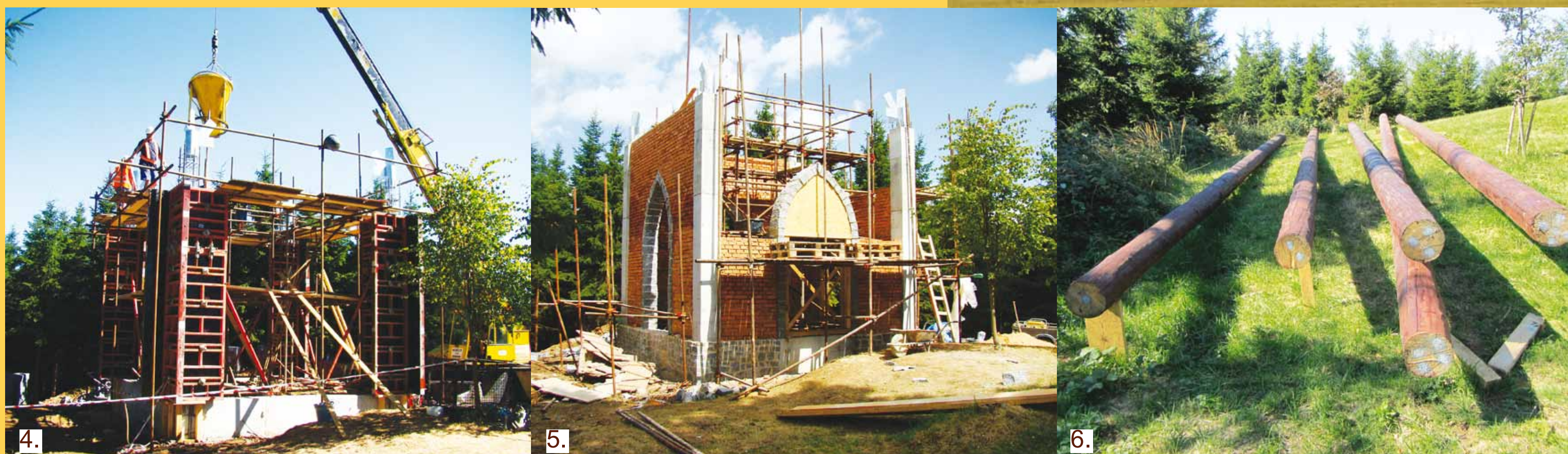
4., 5. - stavba spodní zděné vstupní části, 6. - hlavní dřevěné sloupy