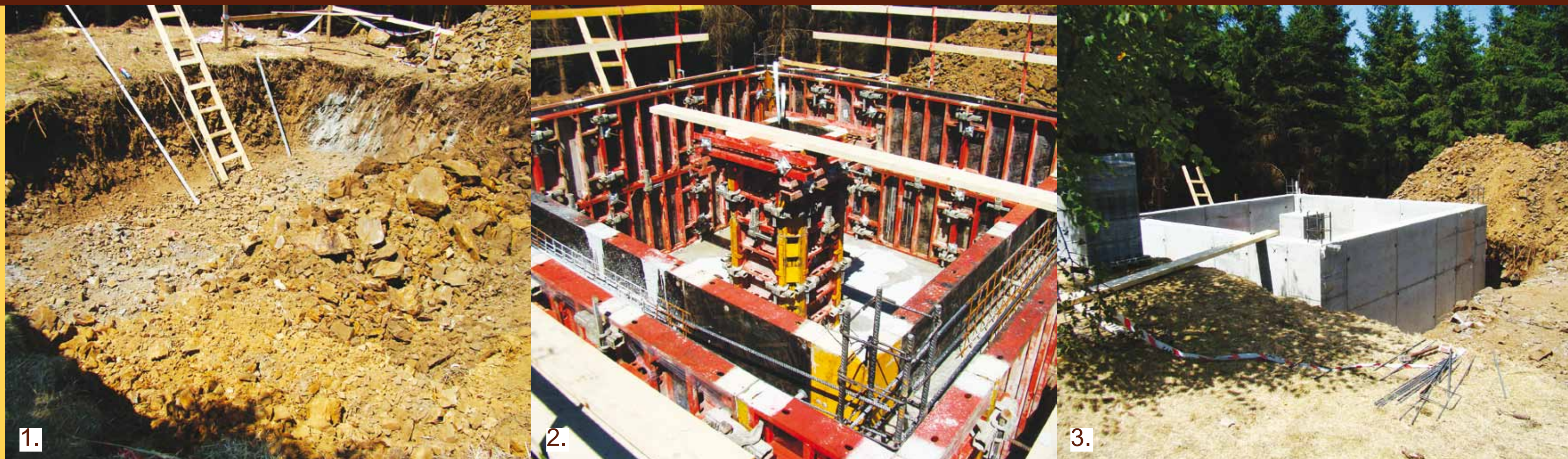
1., 2. 3. - základní jáma a stavba základů rozhledny.

Zdále viditelný vrch sv. Markéty nad Dlažovem s nadmořskou výškou 642 m tvoří od nepaměti dominantu zdejší krajiny. Od roku 1887 stojí na vrchu kaple zasvěcená sv. Markétě. Ve třicátých letech 20. století byla vedle kaple postavena dřevěná rozhledna, která zde stála ještě v roce 1947. Nedlouho poté byla kvůli špatnému stavu odstraněna.